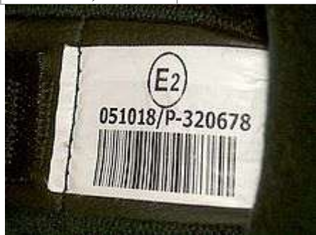
Пример сертифицированного в Европе шлема

Маркировка мотошлемов, сертифицированных в Европе, включает букву E и номер страны внутри круга, наносится изготовителями на внутреннюю часть шлема.